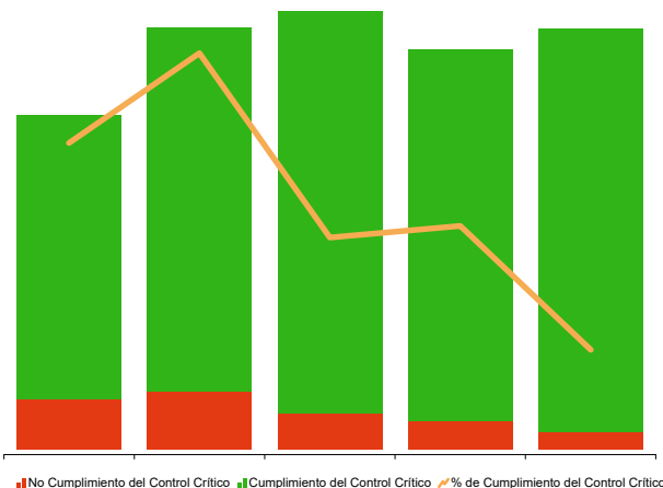
Estadísticas de control crítico de COVID-19 en vivo